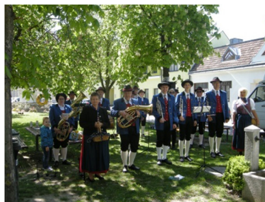
Naschmarkteröffnung Kirchberg am Wagram